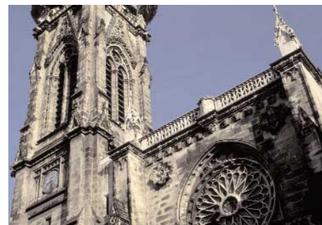
Cathédrale de Saint Jacques

En continuant par la rue Carnicería Vieja vous arriverez jusqu'à la plus ancienne église de Bilbao, la Cathédrale de Saint-Jacques. Dirigez-vous jusqu'au Palais John ou siège de la Bourse. C'est le seul endroit d'où vous pourrez voir, dans le Casco Viejo, la Basilique de Begoña.