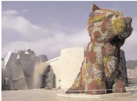
"Puppy" de Jeff Koons

On commencera cette route dans la partie supérieure du musée Guggenheim (1997, Frank Gehry) à côté du chien Puppy (1992, Jeff Koons). D'ici on se dirigera vers la Plaza Moyua à travers la rue Iparraguirre. On trouvera des édifices singuliers à visiter: