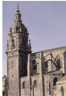
Eglise de San Antón

En revenant au Palais Euskalduna, vous prendrez le Paseo de Abandoibarra, zone emblématique de la régénération urbanistique de Bilbao dont son avenue principale, bordée de statues, vous ramène à nouveau jusqu'au musée Guggenheim. Cette fois ci, on vous conseille de faire une halte dans la partie postérieure pour admirer la magnifique araignée dénommée "Mama" (Louise Bourgeois) qui appartient à la collection du Musée.