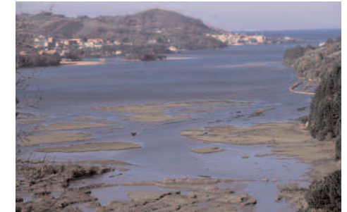
Réserve de la Biosphère de Urdaibai

Comment arriver Prendre la A-8 jusqu'à la sortie Amorebieta-Etxano puis continuer par la BI-635 qui traverse la Réserve du Sud au Nord, en passant par