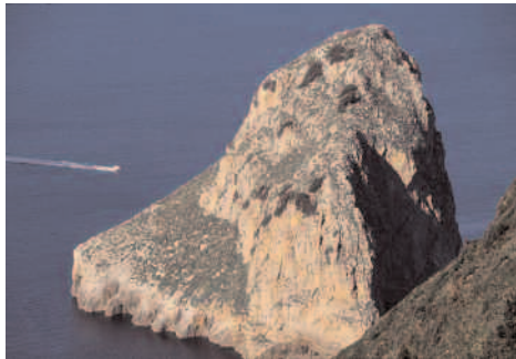
Ilot de Aketxe

biotopes protégés les plus caractéristiques et intéressants de la côte de Biskaia. Entre Bakio et Bermeo, San Juan de Gaztelugatxe est une île qui est unie à la terre ferme par une succession de plus de 200