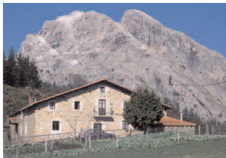
Parc Naturel de Urkiola

Informations et Activités C'est un des parcs les plus visités et emblématiques du Pays Basque. Situé au centre