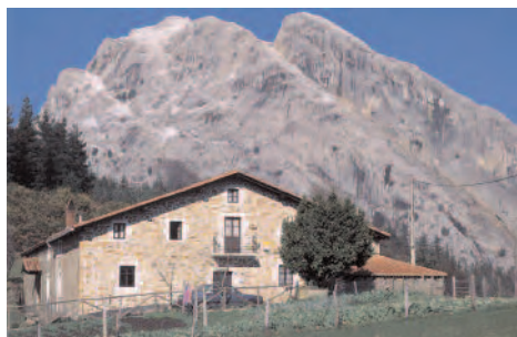
Parque Natural de Urkiola

Varía desde la cima del Amboto (1.330 m) hasta el arroyo de Uzkulueta (240 m)