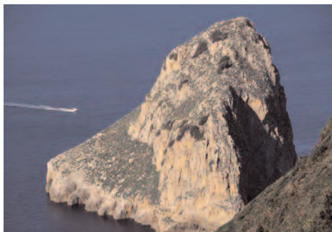
Isote de Aketxe

Bakio y Bermeo. San Juan de Gaztelugatxe es una isla adentrada en el mar unida a tierra mediante la sucesión de más de 200 escaleras. Para la ascensión de las mismas, y conseguir un favor, dice la tradición que hay que comenzar con un pie y acabar con el contrario. De no acabar así la ascensión comenzada no será válida teniendo que descender y volver a ascender para conseguir lo solicitado. Esta es una de las tantísimas leyendas que rodean la ermita cuyo origen data del siglo X, pudiendo haber sido un monasterio templario según documentos antiguos. Dentro de las actividades que se pueden realizar, teniendo en cuenta que se trata de un biotopo protegido, la más característica es la observación de todo tipo de aves, entre las que destacan el paíno común.